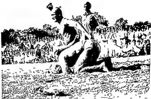
Fig 5 Vajramuṣṭi Wrestling End